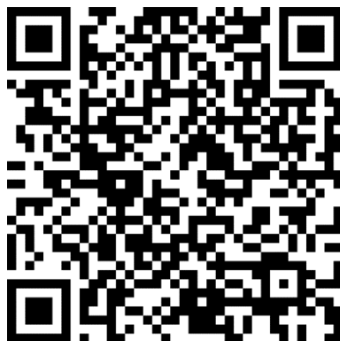
QR CODE 2 TUTORIAL

OBS: 04: Os policiais militares incluídos no LIMITE QUANTITATIVO , deverão entregar para o P/1, de suas Unidades em tempo hábil as CERTIDÕES NEGATIVAS , conforme tabela abaixo.