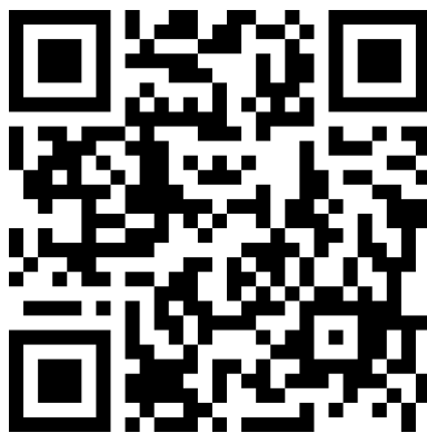
QR CODE 1 FORMULÁRIO

OBS 01: Os Resumos Históricos, Fichas de Conceitos e Certidões nada consta devem ser remetidos a CPPPM mediante ofício ao Presidente CPPPM, em MÍDIA (PDF) pelo formulário vinculado ao QR CODE abaixo: