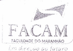
TABELA DE PREÇOS DE CONVÊNIOS CURSOS PRESENCIAIS PERÍODO 2021 - 2