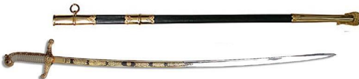
Imagem 13 – Espada do Comandante Geral

Apresenta ao centro, em uma face adornos com emblema Polícia Militar e na outra face ramos de carvalho.