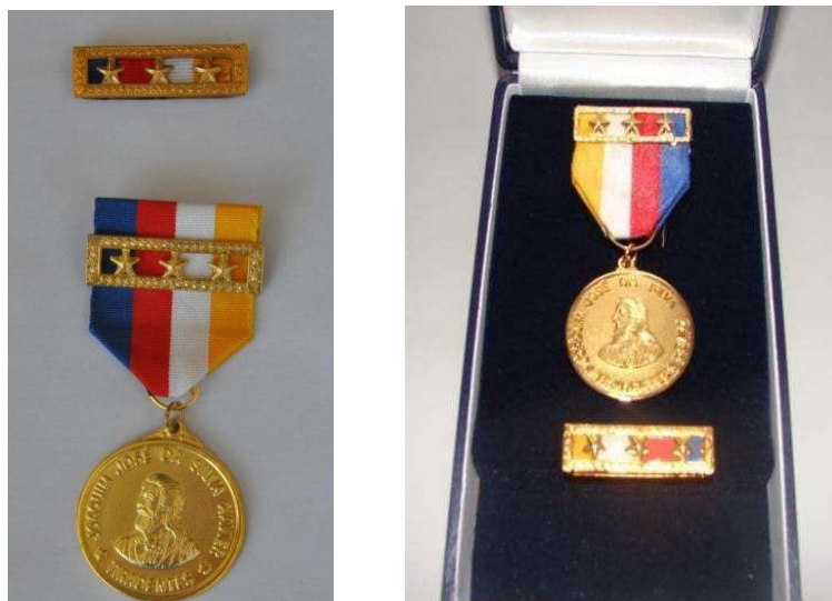
Imagem 5 – Medalha de 30 anos de serviço

A medalha será acompanhada de um diploma, que terá as seguintes dimensões: 35 cm de comprimento e 25 cm de altura e será em papel pergaminho e Estojo de madeira, forrado externamente com papel couro azul e internamente com veludo azul.