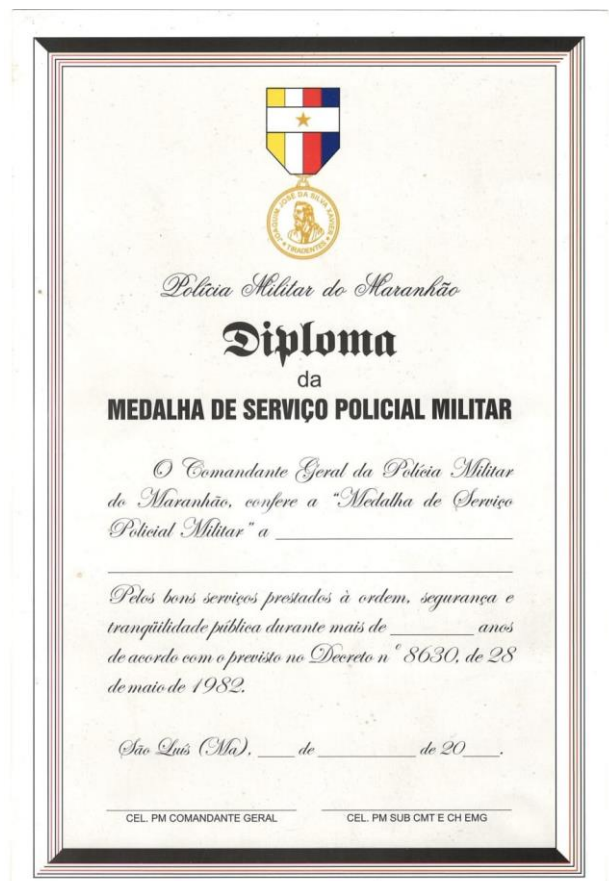
Imagem 2 – Diploma da medalha de 10 anos de serviço