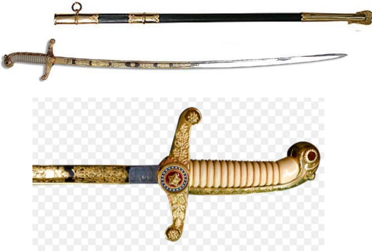
Imagem 13 – Espada do Comandante Geral

Apresenta ao centro, em uma face adornos com emblema Polícia Militar e na outra face ramos de carvalho.