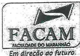
TABELA DE PREÇOS DE CONVÊNIOS CURSOS PRESENCIAIS / PEDAGOGIA DA ALTERNÂNCIA PERÍODO 2024 - 2