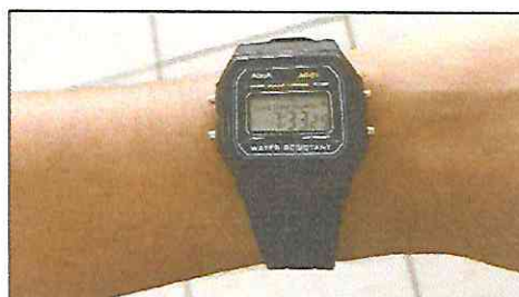
Relógio preto (pulseira de silicone sem detalhes em outras cores)