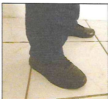
Tênis de couro preto sem detalhes