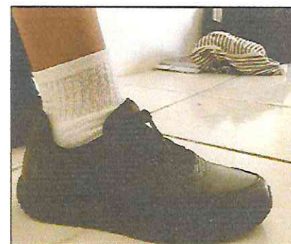
Meia branca de algodão sem detalhes (cano médio)