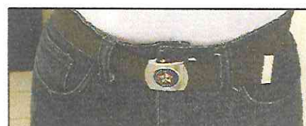
Cinto cinza com Brasão da PMMA na fivela