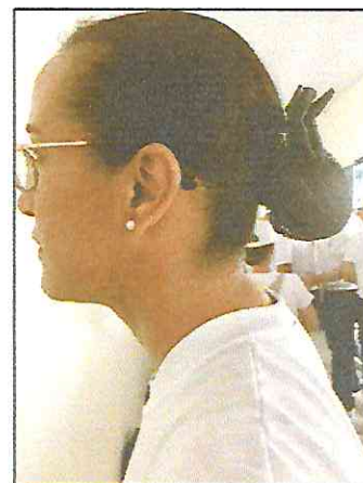
Laço preto com redinha (sem detalhes) e par de brincos de ponto