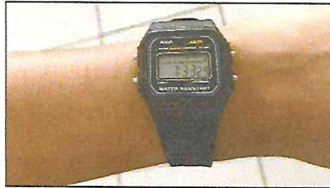
Relógio preto (pulseira de silicone sem detalhes em outras cores)