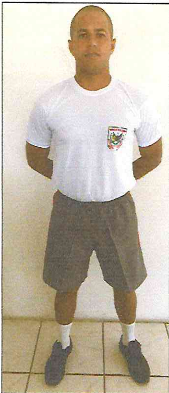
Uniforme de Educação Física