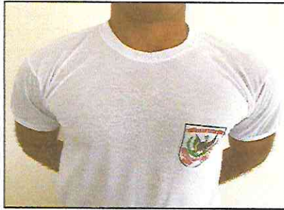
Camisa branca com Brasão da APMGD, gola e manga sanfonadas