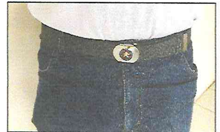
Cinto cinza com Brasão da PMMA na fivela