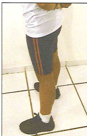
Short com duas listras laterais vermelhas