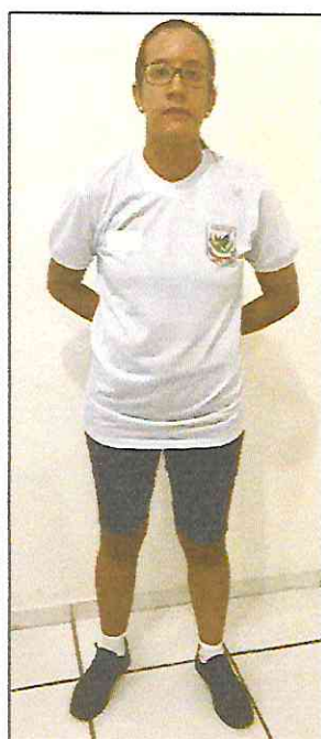
Uniforme de Educação Física