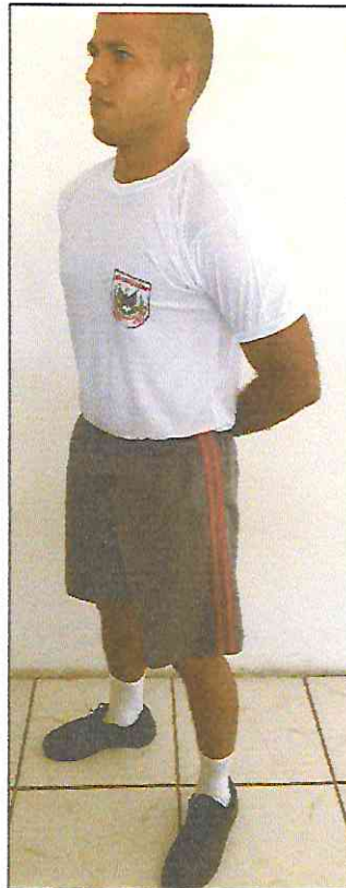
Short com duas listras laterais vermelhas