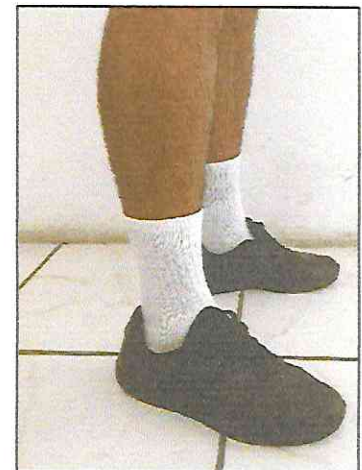
Meia branca de algodão sem detalhes (cano médio)