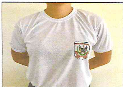
Camisa branca com Brasão da APMGD, gola e manga sanfonadas