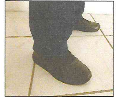
Tênis de couro preto sem detalhes